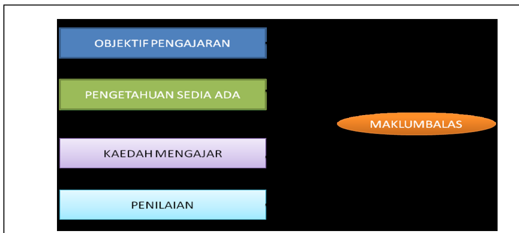
Rajah 2.1: Model Pengajaran Robert Glaser

Objektif pengajaran merupakan objektif-objektif yang perlu dicapai oleh murid- murid setelah selesainya penyampaian satu-satu bahagian pengajaran.