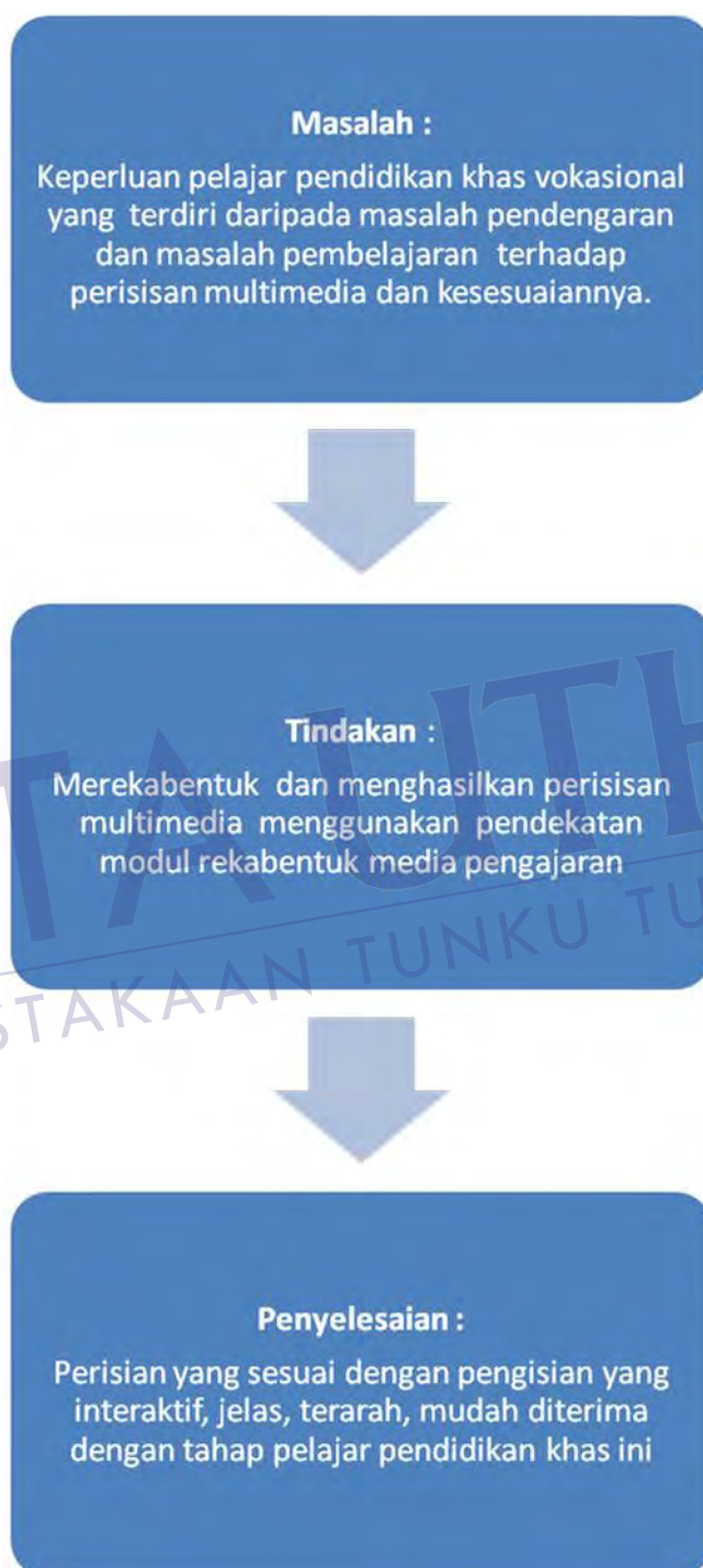
Rajah 1.2 : Kerangka Konsep