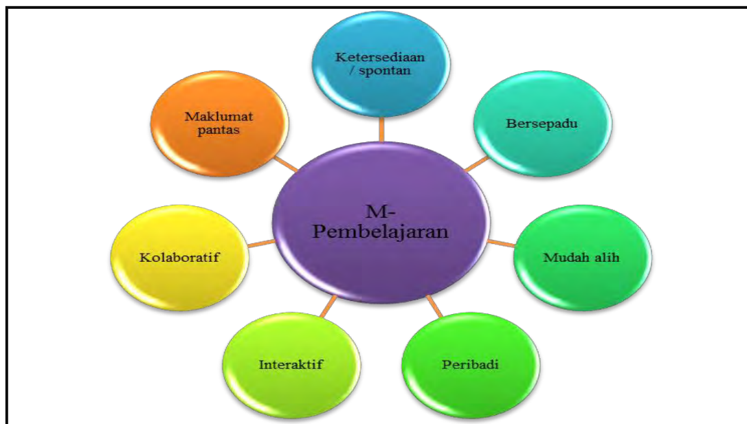
Rajah 2.2: Ciri-ciri M-pembelajaran