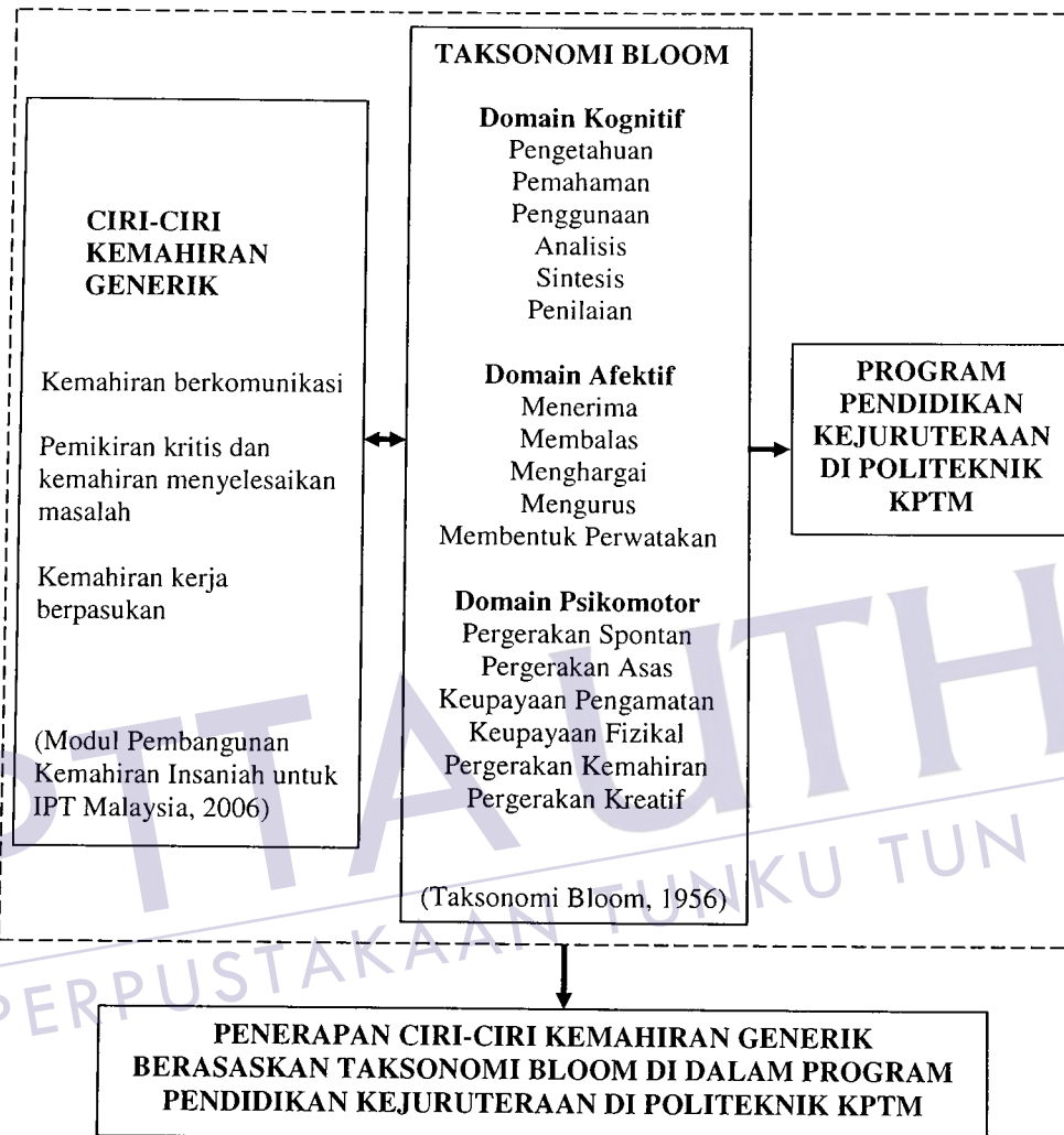
Rajah 1.1 : Kerangka Kerja Teoritikal Kajian.