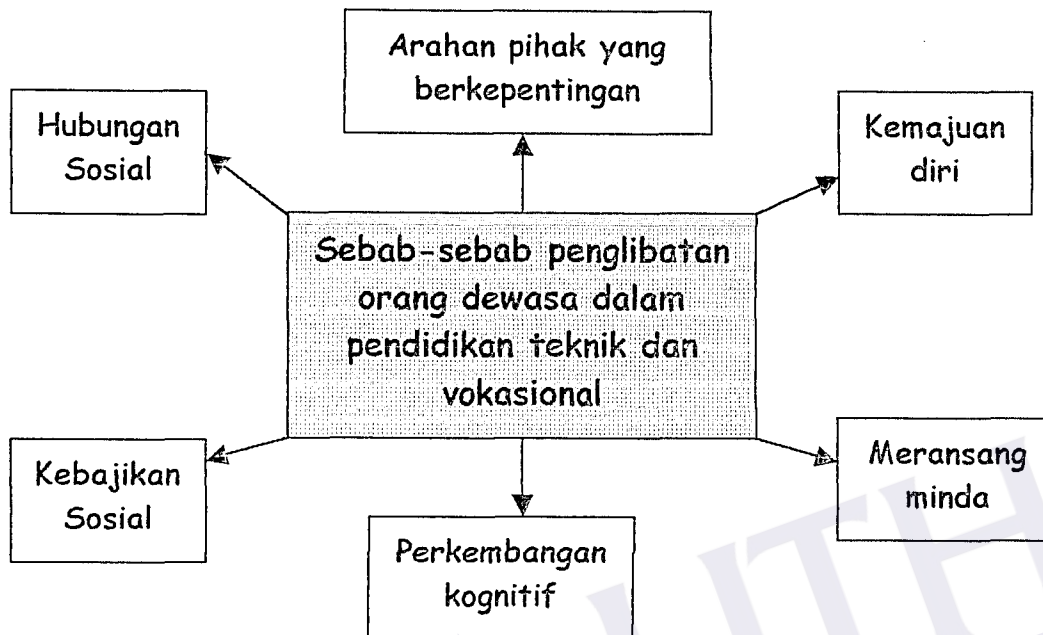
Rajah 1 : Sebab-sebab penglibatan orang dewasa dalam pendidikan teknik dan vokasional.

Diharapkan hasil kajian pengkaji menghasilkan kerangka teori seperti di atas, kerangka teori tersebut mengelaskan faktor-faktor penglibatan orang dewasa dalam pendidikan dewasa kepada 6 bahagian :