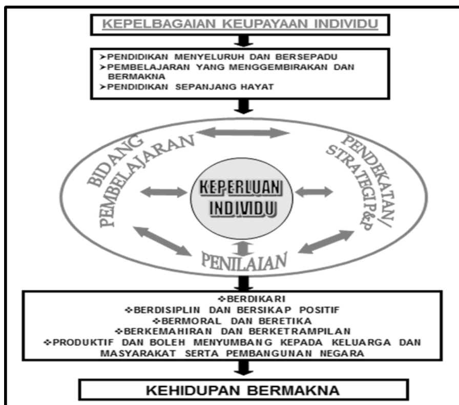
Rajah 2.1: Model Konseptual Kurikulum Pendidikan Khas

Rajah 2.1 di atas menunjukkan bahawa kurikulum MBPK MP digubal dengan melihat kepada kepelbagaian keupayaan individu murid ke arah arah mendapat kehidupan bermakna. Oleh itu, perkhidmatan pendidikan yang disediakan untuk murid-murid tersebut adalah secara menyeluruh dan bersepadu, pembelajaran yang mengembirakan dan bermakna serta pendidikan sepanjang hayat. Keperluan murid adalah dalam bidang pembelajaran, bentuk penilaian dan pendekatan atau strategi PdP dalam menghasilkan murid yang berdikari; berdisiplin dan berfikiran positif; bermoral dan beretika; berkemahiran dan berketrampilan; produktif dan boleh menyumbang kepada keluarga; dan masyarakat serta pembangunan negara. Oleh yang demikian, Kurikulum Pendidikan Khas bermatlamat untuk menyediakan ilmu pengetahuan dan kemahiran melalui proses PdP yang fleksibel untuk memenuhi keperluan individu dengan pelbagai tahap keupayaan ke arah kehidupan bermakna (Peter et al. , 2010).