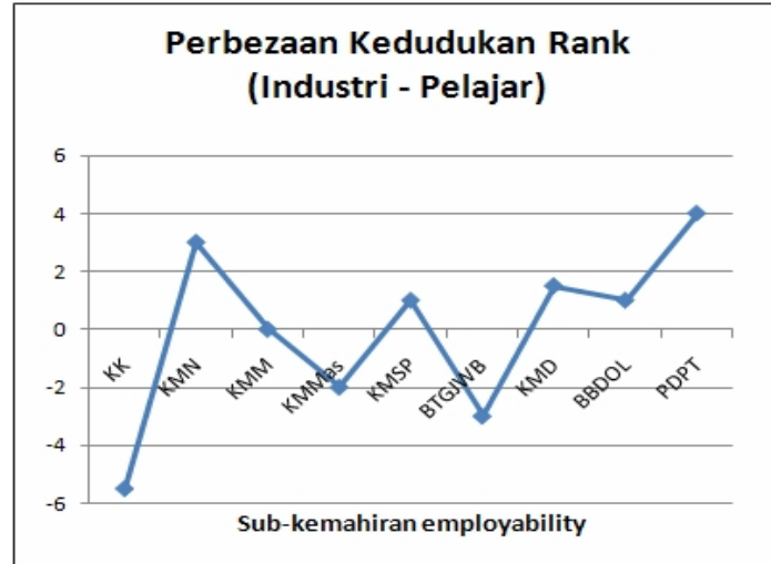
Rajah 2: Nilai Perbezaan Kedudukan Rank Industri & Pelajar

Rajah 2 menunjukkan nilai perbezaan rank kedudukan industri dan pelajar. Berdasarkan rajah tersebut terdapat tiga sub-kemahiran yang berada di bawah aras kosong dengan memberi nilai negatif pada perbezaan tersebut. Ini bermaksud bahawa pada sub-kemahiran tersebut rank kedudukan pelajar adalah lebih tinggi berbanding rank kedudukan industri bagi elemen tersebut. Manakala, nilai perbezaan positif pula membawa maksud sebaliknya dan nilai perbezaan kosong pula dikatakan tidak mempunyai perbezaan dari segi rank kedudukan sub-kemahiran tersebut.